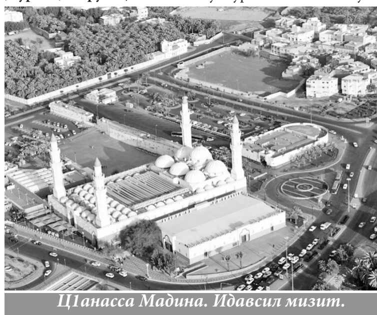
Цланасса Мадина. Идавсил мизит.

- «Ясин. Камилсса аькълуллул Къурандалин хъа буллай ура, ина, Аллагнал расул, тлайласса ххуллий ушиврий... На лакъав миннал яру, миннал цичлав къачлалачлиссар». (Къуран, сура 36, аятру 1-9).