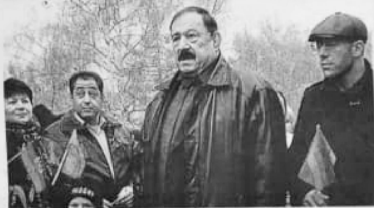
На закладке Аллеи Народного Единства, 2015 год