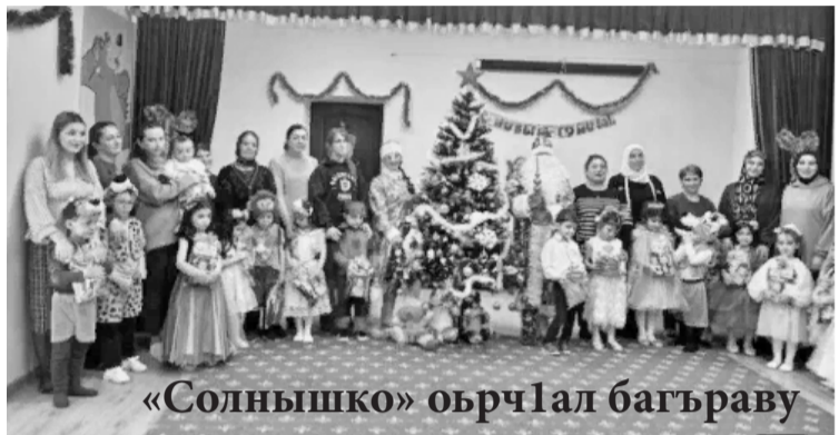
«Солнышко» оърчал багъраву